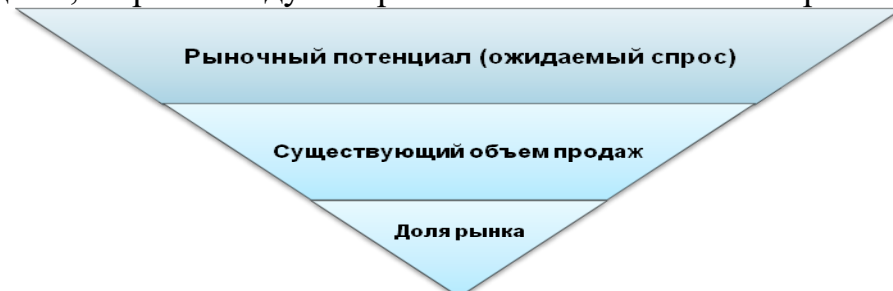
Рисунок 2 - Емкость и доля рынка

Целевая доля рынка может быть использована в проекте как основание для прогноза объема продаж. Если же ожидаемый объем продаж рассчитан другими методами, то рекомендуется рассчитать на его основе прогноз доли рынка.